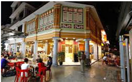
Quartier Tiong Bahru